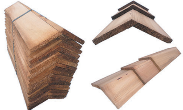
設計価格 19,000円/束 (3,800円/m 葺足140mm)