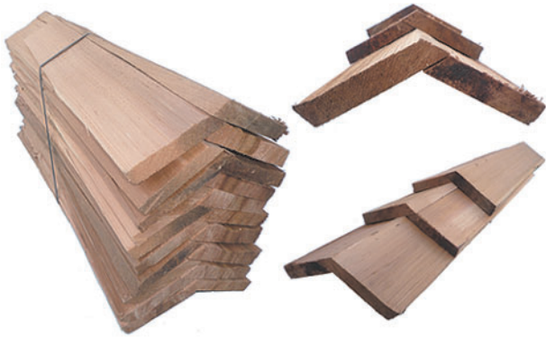
設計価格 39,600円/束 (10,421円/m 葺足190mm)

シダーシェイク・シングル用リッジキャップ(棟用の役物)です。シェイク・シングル同様、レッドシダーのクリア材から加工したプレミアムグレード、NO.1グレードと最高級のグレードです。